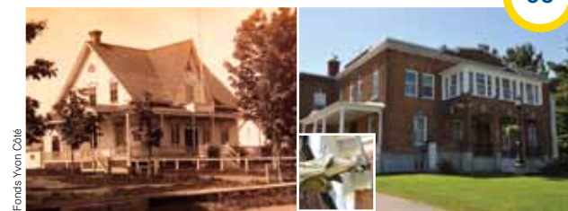
Le presbytère en 1888