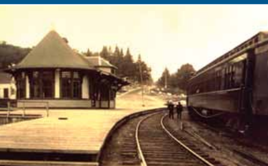
La gare du Canadien Pacifique en 1914. Située près du coin des rues Préfontaine est et Demontigny.

Parcourant les rues du centre-ville de Sainte-Agathe-des-Monts, vous serez plongés dans un univers issu du développement touristique du début du vingtième siècle. De l'architecture villageoise aux grandes villas, vous découvrirez un pan de notre histoire des Pays-d'en-Haut qui a fait le tour de la province et des états américains du nord-est. Renommée pour ses paysages et la qualité de son air, Sainte-Agathe-des-Monts s'est refait une beauté afin de vous accueillir.