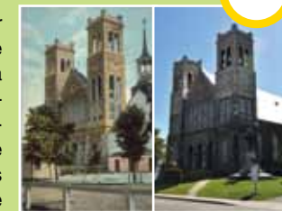
L'ancienne église de bois côtoie la nouvelle inaugurée en 1907.