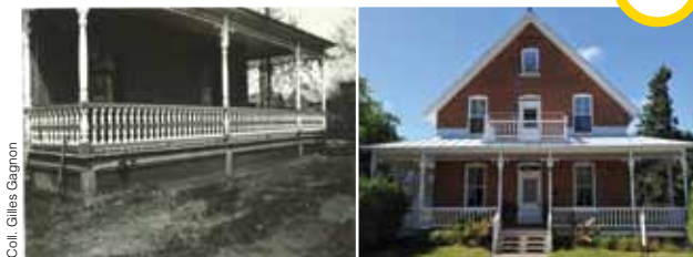
Point de vue du balcon arrière de la maison entre 1935 et 1938