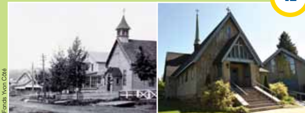
Eglise anglicane, premier emplacement entre 1899 et 1911

L'arrivée du train en 1892 a favorisé l'établissement de la communauté protestante anglophone. Au départ, les services religieux étaient tenus dans des résidences privées ou à l'hôtel Castel des Monts, mais en 1897, grâce à des efforts collectifs, un terrain a été acheté pour bâtir une église. L'édifice a été offert par le maire de Montréal, R. Wilson Smith.