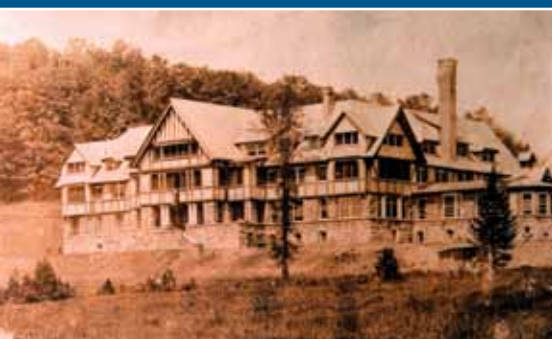
Laurentian Sanatorium 234 rue St-Vincent